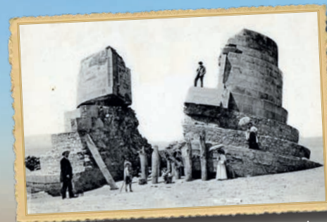
Ruines du phare en pierre

Le 21 mai 1907, le phare en pierre s'effondre.