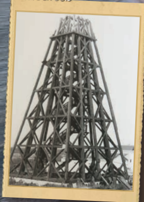
Phare en bois

Un premier phare en bois, haut de 28m, est allumé.