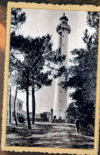
Phare en béton

Construction du phare actuel, en béton, à 1,8 km du rivage et allumé le 1 er octobre 1905.