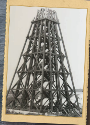
Phare en bois

Un premier phare en bois, haut de 28m, est allumé.