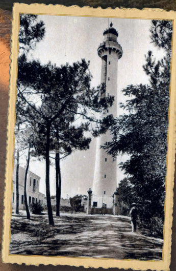
Phare en béton

Construction du phare actuel, en béton, à 1,8 km du rivage et allumé le 1 er octobre 1905.